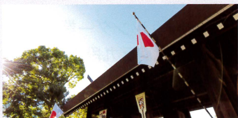
1-2月 靖國神社正月風景

●靖國神社への総理・閣僚の公式参拝を定着させましょう ●「靖國神社は、我が国の戦歿者追悼の中心的施設である」 国家、国民がこぞって戦歿者英靈に感謝の誠を捧げましょう ●英霊顕彰の国民運動の輪をひろげましょう 「靖國カレンダー」を一家に一部掲げましょう