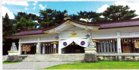
11-12月 御祭神177,900余柱・沖縄縣護國神社