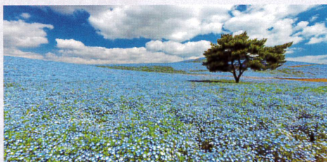
3-4月 水戸飛行場跡地に整備された国営ひたち海浜公園(春のネモフィラ)