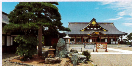
5-6月 御祭神40,800余柱・山形縣護國神社