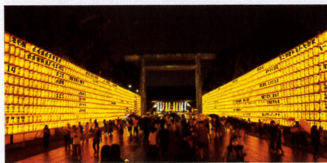
7-8月 3万灯の提灯が彩る令和4年靖國神社みたまま祭り(毎年7月13日~16日)