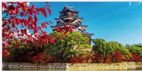
9-10月 秋の広島城(戦前は広島城周辺に陸軍病院など軍の施設が多数存在した)